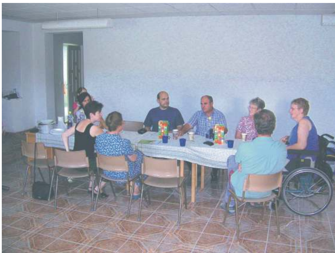
Entréhallen är stor och rymlig. Här har några svenskar och rumäner slagit sig ned tillsammans för en kopp fika vid ett provisorsikt matbord.